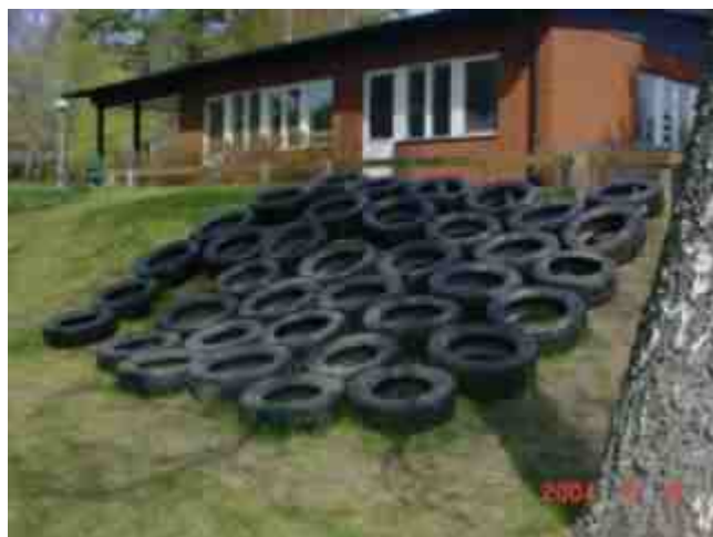
Här har vi en däckvägg som har blivit väldigt populär.

Detta har hänt under 2003 på Sunnerby förskola när det gäller utemiljön.