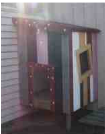
Som pricken över i snickrade och målade några föräldrar en Alfonskoja vid vår uteplats materialet bekostade förskolan.