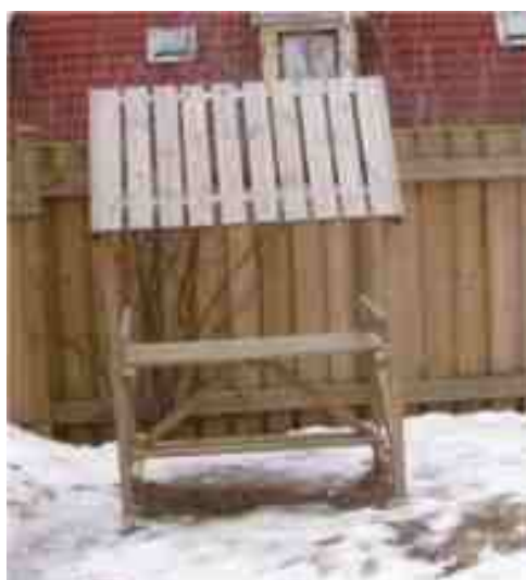
Föräldrarna hjälptes åt att snickra ett torgstånd.