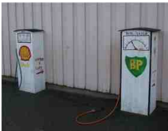
En pappa hjälpte oss att snickra bensinpumpar som personal sedan målade.