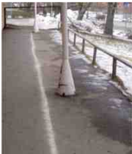
På asfaltvägarna målade vi tillsammans med föräldrar körbanor och parkeringsrutor.