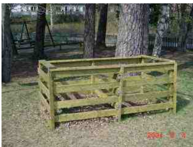
Här har vi komposten som är byggd tillsammans med barnen.