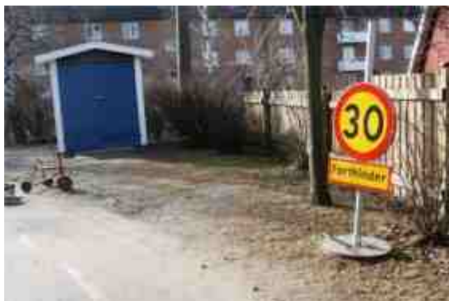
Cykelförrådet flyttat och målat av parken. Vägskylt fixad under gårdskvällen.