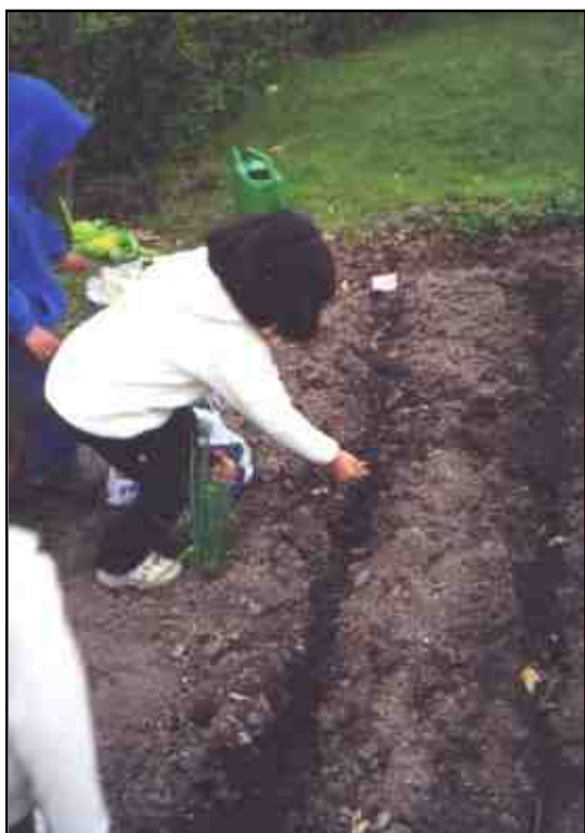
Sådd och skörd på Backlura förskola. Detta är ett sätt att konkret uppleva naturens kretslopp. Upplevelsen är grunden för förståelse och insikt om människan och naturen. Det är inom förskolan som det första steget tas mot en hållbar framtid.

Arbetet med gårdarna måste göras långsiktigt (gårdar slits och det tar tid för träd att växa). Med denna dokumentation avslutas inte bara ett projekt utan ett nytt tar vid där även skolorna kommer att ingå denna gång. Det nya projektet som skall pågå 2004 till och med 2006 har målsättningen att förvalta investeringsbudgetens pengar väl men också att säkra pengar för kommande investeringsbudget.