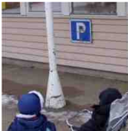
På väggen vid parkerings rutorna satte vi upp en P-skylt. Materialet till detta bekostade vi med förskolans budget.