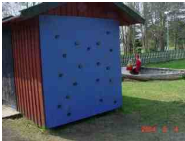
Klättervägg av hockeypuckar