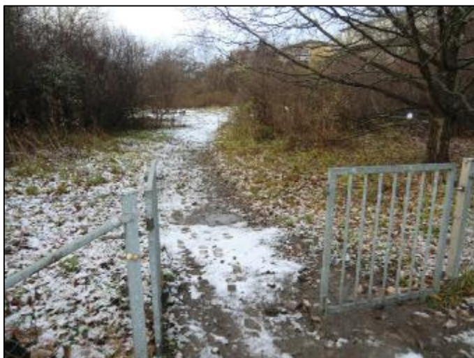
Svandammskolan. Det nya uterummet "Grönan" som ska användas för utomhuspedagogik under lektionstid. Området har begränsats i ena änden av ett staket med stolpar och sly som eleverna själva flätat in.