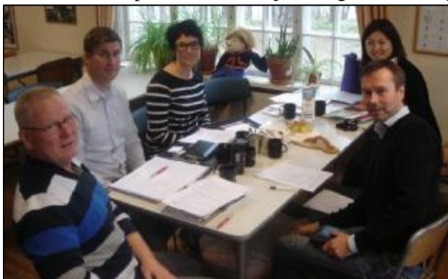
Ett av många viktiga personliga möten detta år. Här är mötet med förlaget Outdoor Teaching och Naturskolans kontakt i Tokyo.