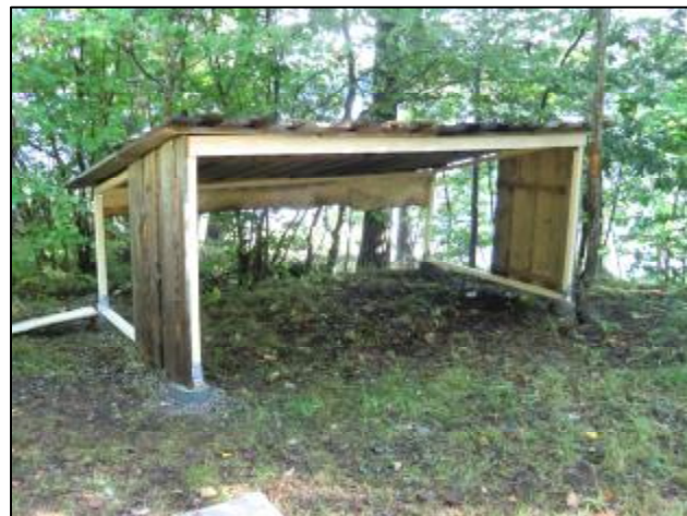
Vind- och regnskyddet ska skydda eleverna eller deras ryggsäckar under besöket på Naturskolan.