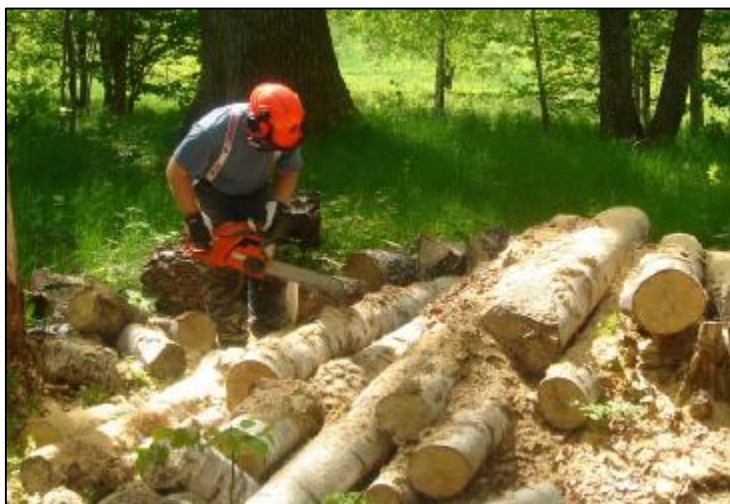
För en naturskolechef gäller det att kunna hantera en motorsåg. Det går åt mycket ved i naturskolans verksamhet. Elden ger en speciell stämning när klassen samlas. För åk 5 är elden i fokus och gott samarbete krävs för att klara uppgifterna i vinterkylan.