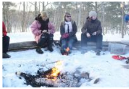
Prova på tema elden precis så som åk 5 gör.