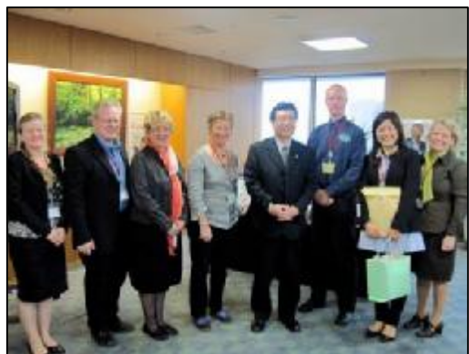
En av många höjdpunkter på resan; mötet med Japans miljöminister i Tokyo 2 april 2010.

En längre artikel och en utförlig rapport om resan till Japan finns på hemsidan www.nynashamnsnaturskola.se