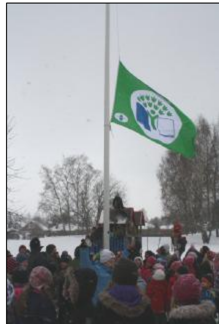
Vanstaskolan hissade sin flagga 3 februari 2010.

December 2010 är 4 förskolor och 4 skolor certifierade enligt Grön Flagg. Enligt Nynäshamns lokala miljömål ska minst 50 % av skolorna och förskolorna vara certifierade enligt Grön flagg eller liknande innan 2012.