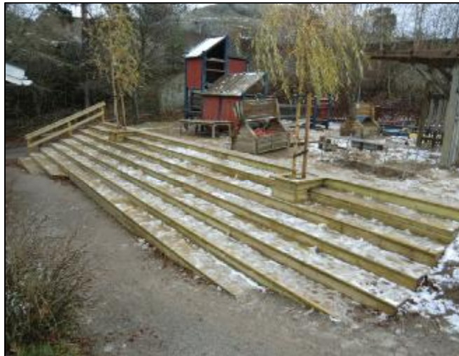
Vaktbergets förskola. En ny trappa med flera funktioner. Trappan stimulerar spring och kan även fungera som sittplatser och läktare. Två träd i trappan ger skugga och ökar trivsln.