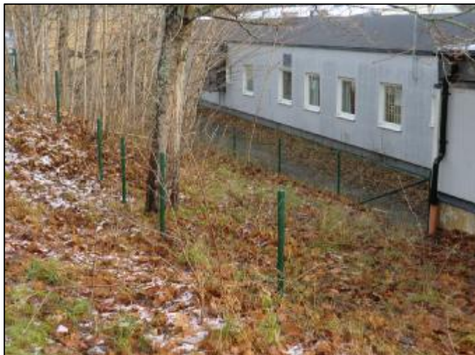
Humlans förskola. Ny mark bakom förskolan har under hösten annekterats genom att ett nytt staket sattes upp utanför det gamla. Träd och buskar kommer att ge mer skugga och ytan ska öka den fysiska aktiviteten hos barnen.