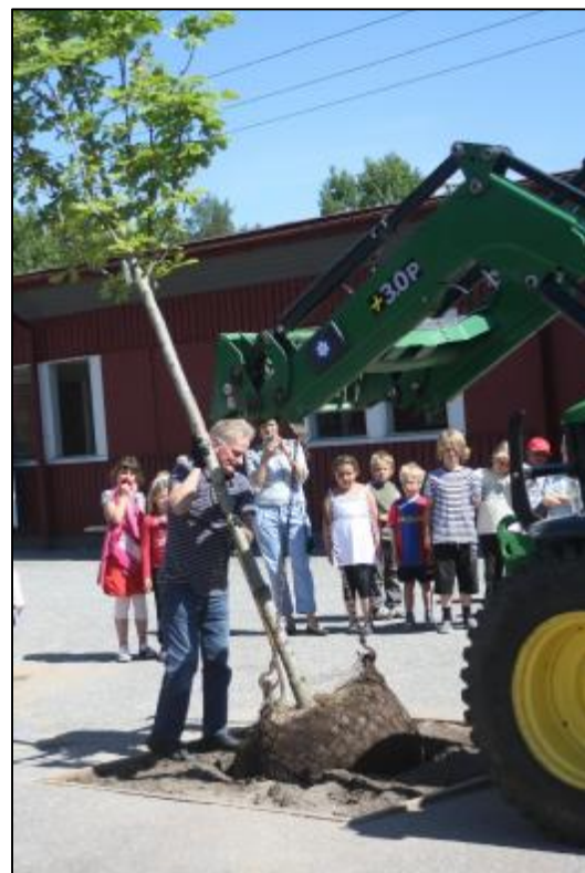
Vanstaskolan. Ett träd planteras i söderläge på den annars karga asfaltsyten för att ge skugga och ökat spring.