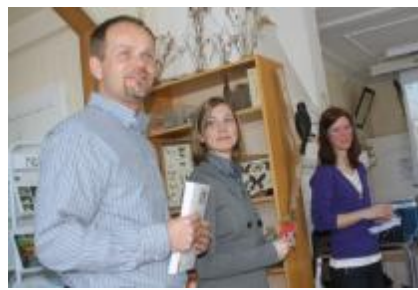
MSF med miljöstrategen i spetsen berättade om Nynäshamns kommun miljöarbete.