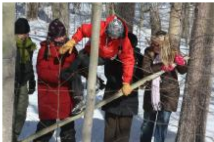
Samarbetsövningar utomhus för att svetsa samman deltagarna från de olika länderna.

I projektet har Nynäshamns Naturskola under året producerat några läromedel. Det ena "växternas kretslopp" handlar om hur man kan arbeta med växter och hållbar utveckling. Häftet innehåller 40 olika övningar med åk 1-9 som målgrupp. Det andra läromedlet är ett häfte som handlar om vattenresurser och är tänkt att användas som ett hjälpmedel för skolor och förskolor när de ska arbeta med Grön Flagg och väljer temat vattenresurser. Målgruppen är förskola till åk 9 och häftet är strukturerat så att man som lärare kan använda målen som de presenteras eller att man plockar intressanta aktiviteter eller bara låter sig inspireras.