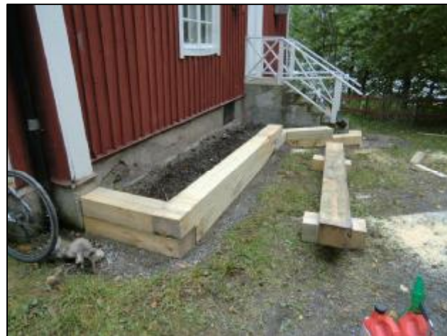
Fjärilslandet börjar ta form. Till våren ska landet locka hit fjärilar och andra insekter. Bygget gjordes under biologiska mångfaldsåret som ett konkret exempel på hur mångfalden kan ökas i närmiljön.

Huset hyrs på vardagkvällar och ett stort antal helger av Ösmo Scoutkår som har omfattande verksamhet i huset och i omgivningarna.