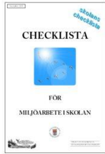
Skolans nya checklista

I september reviderades skolans och förskolans checklista som en anpassning till de nya planerna som antagits under året. I checklistan finns hänvisningar till den nya skolplanen, Barn- och utbildningsnämndens miljö- och hälsoplan, agenda 21-program och folkhälsoprogram. Checklistorna finns på www.nynashamn.se/natursko .