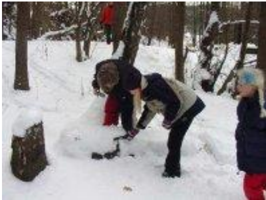
Årskurs 5 hade vinterekologi

Naturskolans ordinarie utbud och är anpassat för de elever med särskilda behov som ingår i dessa två grupper. Arbetet med "Gunilla-gruppen" utmynnade bland annat i en utställning 27 mars under miljöveckan i Vanstaskolan.