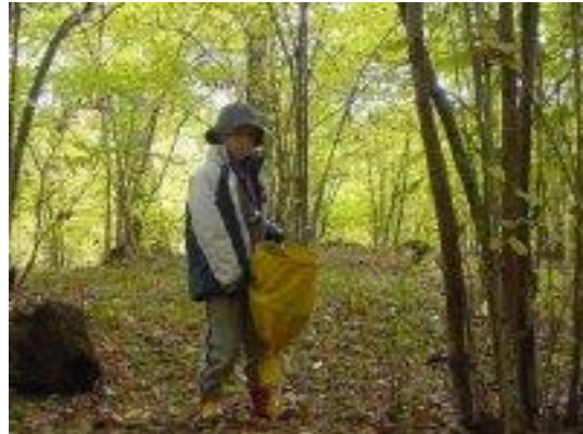
Årskurs 1 letade efter småkryp i skogsbacken