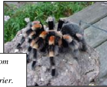
Några av de djur som finns att se i Naturskolans terrarier.