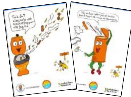
Två kampanjbilder till alla förskolor och lärare i åk f-9.