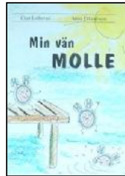
Min vän Molle, bok till alla lärare åk 1.