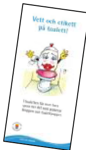
Folder till alla elever i åk f till 9.