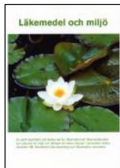
Läkemedel och miljö (bok till alla NO-lärare åk 7 till 9).