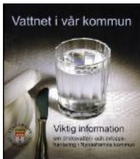
Vattnet i vår kommun. Häfte till alla lärare i åk 5.