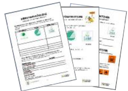
Protokoll för elevernas hemundersökningar. (åk f-3, 4-6, 7-9)