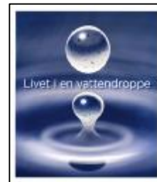
Livet i en vattendroppe, häfte till alla lärare i åk f-9.