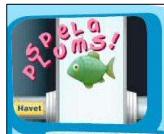
Plums, roligt spel med syfte att lära ut vad som får spolat ner i toaletten. www.gryaab.se