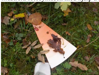
Hitta rätt nyans och som också passar din personlighet.

Att illustrera fotosyntesen med hjälp av färger och drama var också en kul och bra idé, testa!