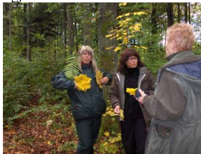
Skogsräet och kolaren får instruktioner