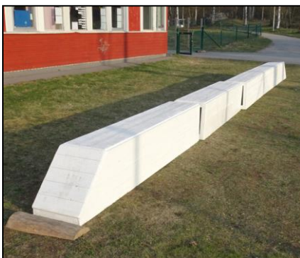
I april kom pendeltåget som Janne byggt under vintern. Tåget var grundmålat och eleverna målar sedan fönster och dörrar.