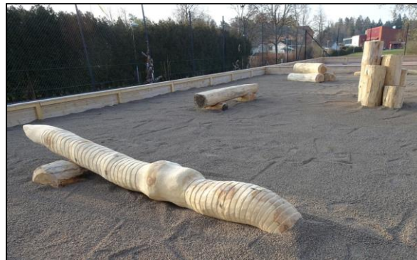
I slutet av april började Vanstaskolans aktivitetspark fyllas med innehåll. Här syns dagmasken och stockpyramiden under uppbyggnaden.