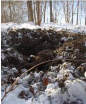
Jord uppbökad av vildsvin