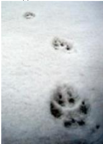
Spår av rävens tassar