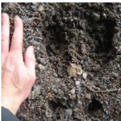
Klövspår av älg