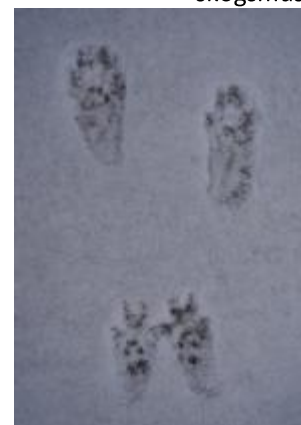
Spår i snö av ekorre

Kryssa för de spår ni sett. Fotografera gärna och påbörja en spårsamling. Lycka till!