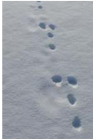
Spår av hare