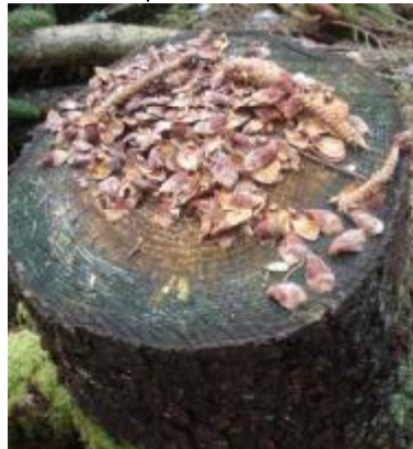
Kotte gnagd av ekorre