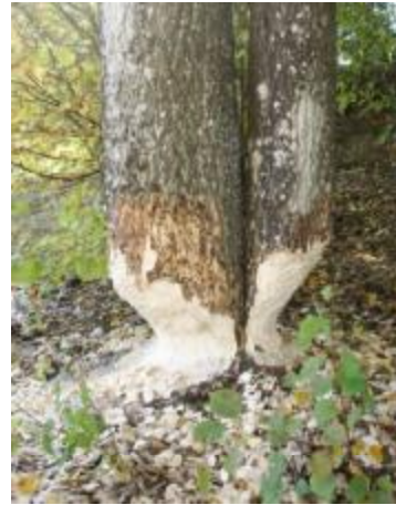
Träd gnagd av bäver