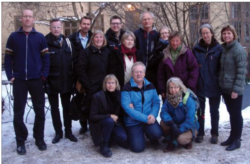
Flera av författarna till böckerna i Att lära in ute -serien träffade förlaget i Stockholm i januari för att diskutera befintliga böcker, kommande böcker och översättningar.

Det finns intresse utomlands för den svenska utomhuspedagogiken, framförallt inom förskolorna. Flera översättningar är redan gjorda och era är på gång. Att lära in matematik ute har översatts till lettiska och delar av den nns på niska, estniska och ryska. Även Att lära in engelska ute nns på lettiska. Leka och lära matematik ute nns översatt till engelska och den