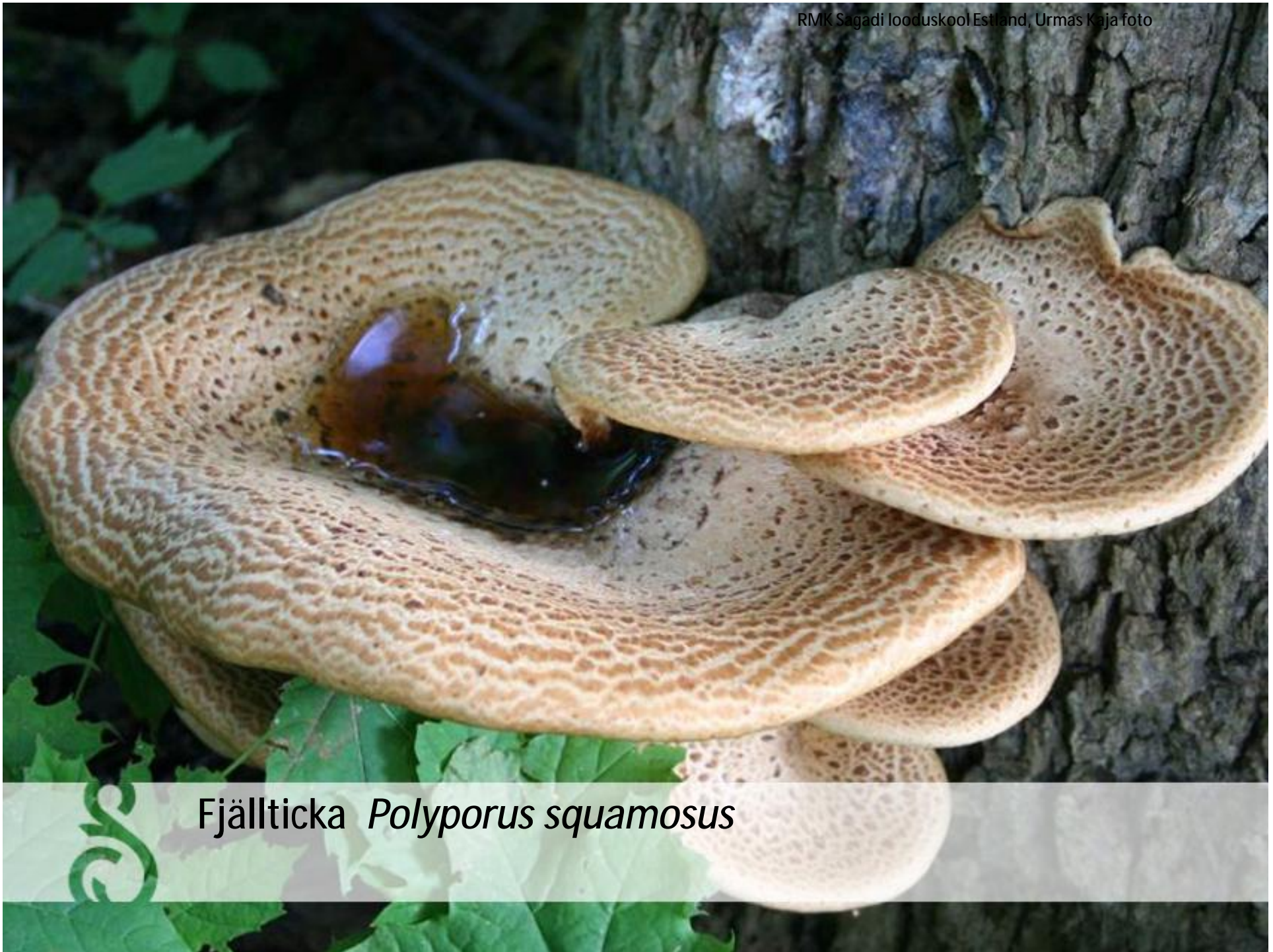
Fjällticka Polyporus squamosus