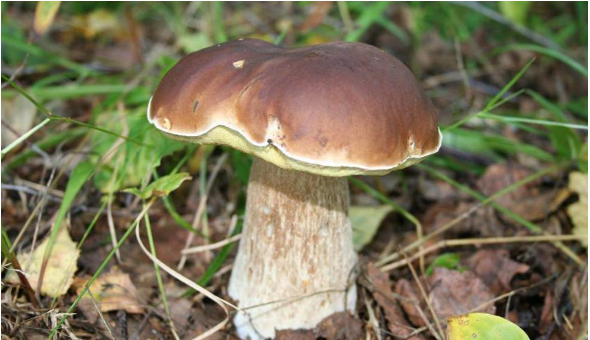
Stensopp (Karl Johan) Boletus edulis