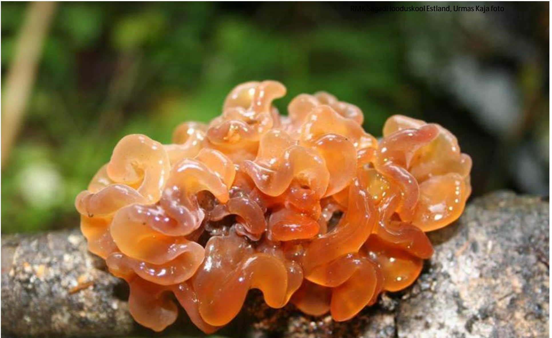
Brunkrös Tremella foliacea , växer på döda träd