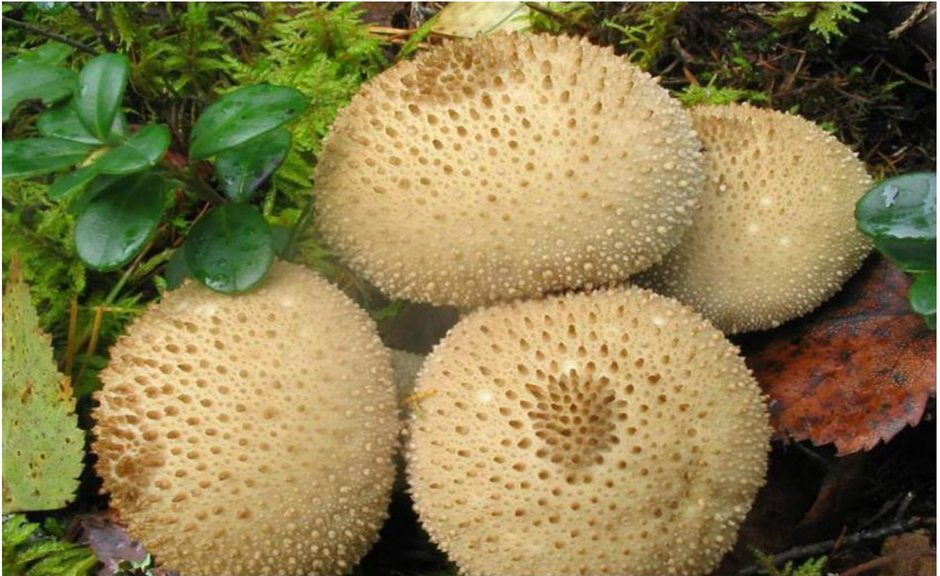
Vårtig röksvamp Lycoperdon perlatum , Tillhör Buksvamparna (Gasteromycetes).

RMK Sagadi looduskool Estland, Urmas Kaja foto