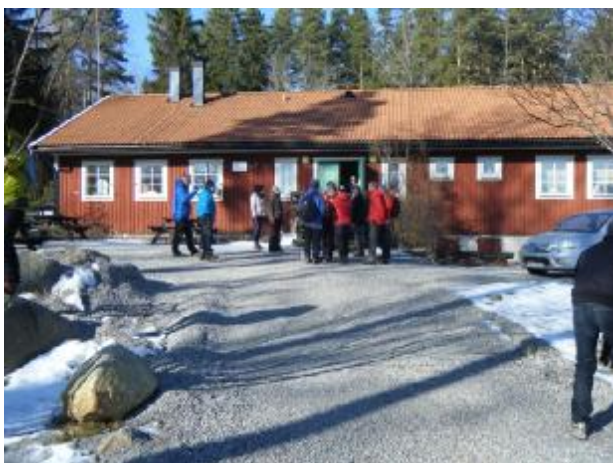
Regionträff på Södertälje Naturskola.