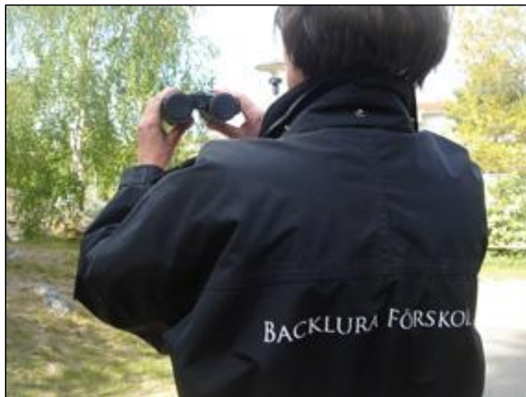
Backlura förskola vann årets fågelmatartävling och fick en kikare.

Årets fågelmatartävling avslutades i mars. Backlura vann detta år och tilldelades en kikare i pris. Syftet med tävlingen är att mata fåglar för att de ska överleva vintern och samtidigt väcka ett intresse för fåglar hos barn och elever.