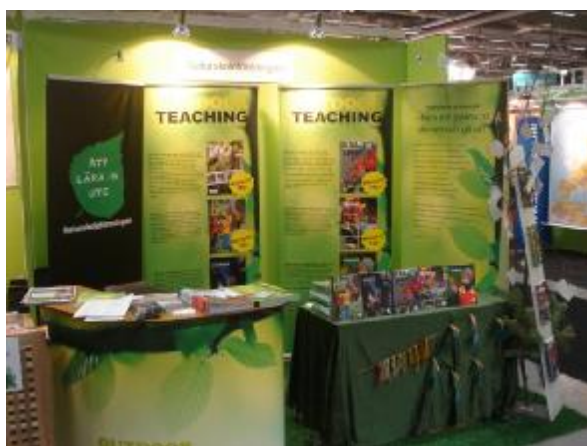
Nynäshamns Naturskola fanns med i Naturskoleföreningens och Outdoor Teachings gemensamma monter på Skolforum en dag detta år.