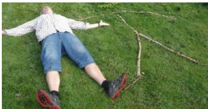
Utematte. Skala 1:1. En av de nya övningarna ur boken Att lära in matematik ute 2 som släpptes 2012.

Kommentar: 6 timmar räknas som heldag. Oftast ges kurserna 9-12 och 13-16 med lunch däremellan.