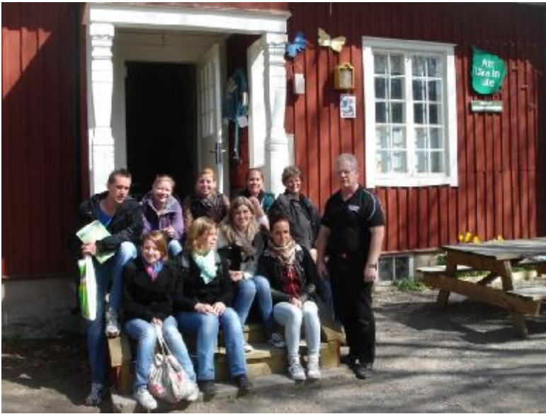
Holländska lärare intresserade av utomhuspedagogik besöker Nynäshamns Naturskola i maj 2012.