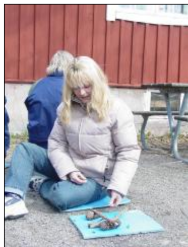
Utomhusmatematik för förskolan i april. Deltagarna skapar en "hemlig bild" som ska beskrivas med det matematiska språket.