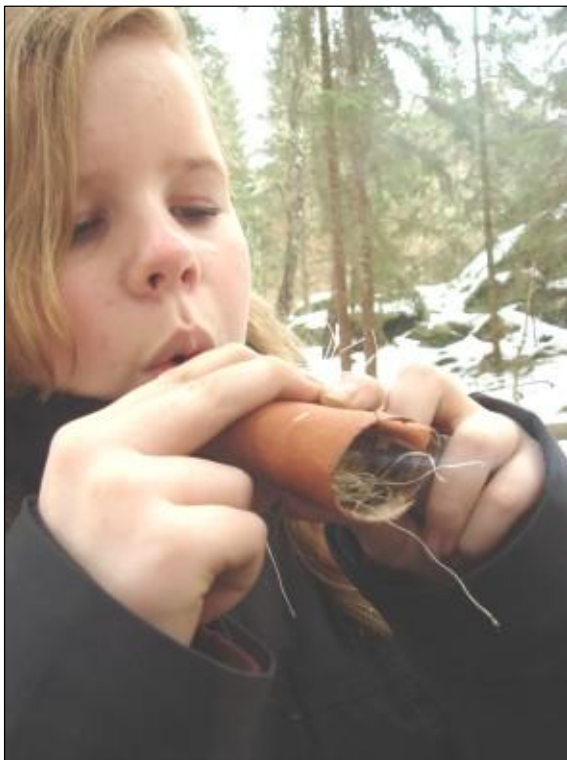
Elever från Vanstaskolan med vedlager, elev från Viaskolan blåser liv i elden och elever från Svanis värmer händerna efter att äntligen ha fått upp eld.