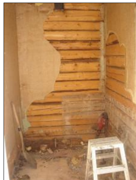
Badrummet i juni 2007. Gjutjärnsbadkaret avlägsnades efter hårt slit av hantverkarna.

Huset hyrs på vardagkvällar och ett stort antal helger av Ösmo Scoutkår som har omfattande verksamhet i huset och i omgivningarna.