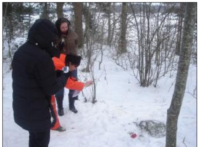
Samarbetsövningar i Tullinge och Nyckelpigans äventyr med digital dokumentation ute vid Naturskolan.