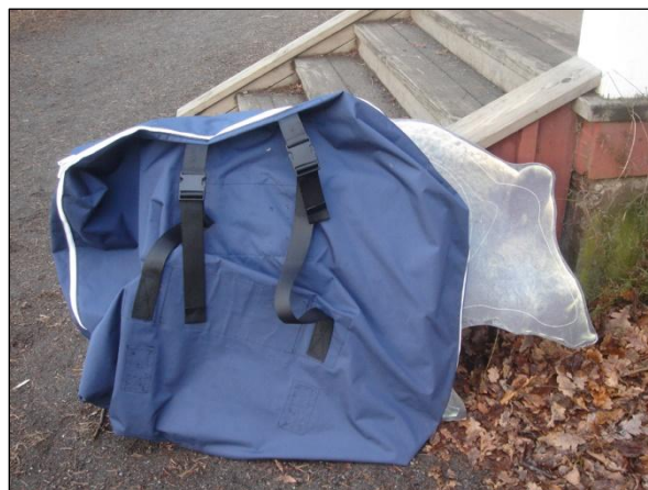
En specialsydd ryggsäck av segelduk till de stora djurskyltarna.