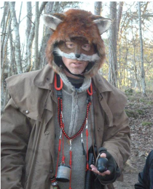
Räv Räv eller Haren Hare vägleder eleverna längs stigen och bjuder på olika pedagogiska aktiviteter.

Vi går stigen fram och eleverna upptäcker varje djur och vi stannar. Vid varje djur berättar vi om djuret och visar olika föremål förknippade med djuret, t.ex. klöv, tass, kranium. Deras ljud demonstrerar vi med lockpipor eller ljudburk. Exempel på fakta är deras sinnen, föda, fiender, spår, läte, utbredning, betydelse för människan historiskt och i nutid.