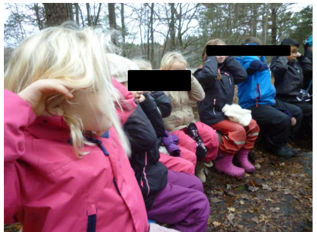
Eleverna provar att förstora sina öron för att höra bättre, som en älg.

Älgens öron är 60 gånger större än människans. Vi tar fram plastkopior av älgöron och visar eleverna att de är vridbara för att älgen ska kunna lyssna både framåt