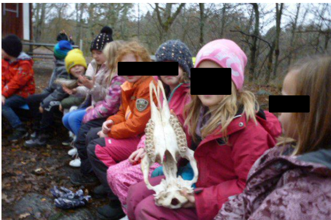
En älgskalle att väga i handen och känna på tänderna runt lägerelden.