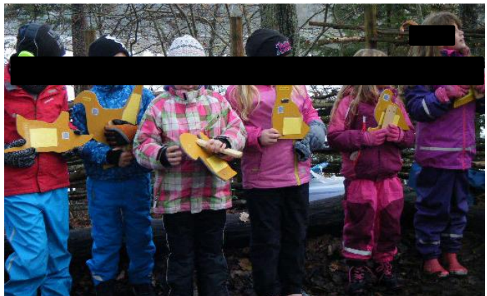
Eleverna försöker få ihop en mening av orden på djurskyltarna.