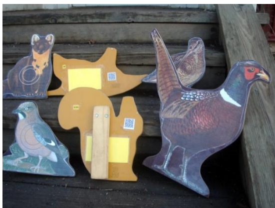
Djurskyltarna med ord och QR-kod på baksidan.

Vid promenadens slut samlas eleverna. Läraren har i förväg delat in eleverna i sex grupper. Grupperna har namn efter de däggdjur som vi träffat på däggdjursstigen. Vi berättar att varje grupp ska leta efter ett djur på vänster sida om vägen. När de hittat sitt djur ska de ta med sig det och samlas runt lägerelden. Vi släpper iväg en grupp åt gången samtidigt som vi rör oss mot huset. Grupperna letar efter och hämtar sina djur (inte samma djur som vid promenaden) som är gömda i skogen. På baksidan av djurskylten sitter en ett ord som tillsammans med de andra gruppernas ord bildar en mening. Orden på baksidan av djuren är: NU KAN NI BLI DÄGGDJURENS VÄNNER.