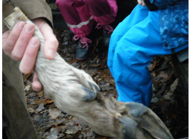
Eleverna känner på älgens klövar och får en känsla för storleken. Älgen är ett klövdjur, eller partåigt hovdjur, som går på tåpetsarna.

och bakåt. Eleverna får prova att förstora sina egna öron med hjälp av händerna och lyssna framåt. Bakåt lyssnar de genom att kupa händerna åt andra hållet. Älgtjurarna har också hornen till hjälp för att styra ljud mot öronen, som en parabol. Älgens näsa är 200 gånger större än människans. I gommen har älgtjuren dessutom en extranäsa, det så kallade vomeronasalorganet, som den kan använda under brunsten. Den drar då tillbaka överläppen och drar in luft för att kunna känna doften av en älgko.