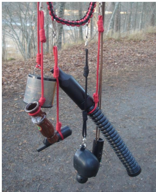
Lockpipor som normalt används vid jakt använder vi för att illustrera djurens olika läten.