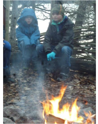
Elden brinner när eleverna kommer på morgonen.

Runt elden får eleverna se och känna på olika delar av en älg. Vi berättar om att älgkorna och älgdjurarna måste använda sina sinnen för att klara av utmaningen att träffas i skogen trots att det är så många träd i vägen.