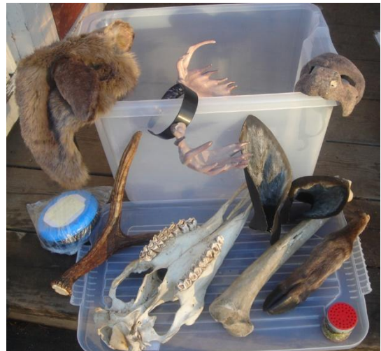
I vår älgglåda har vi kranium, öron, ben, klövar, päls och horn som vi kan visa eleverna och ljudburkar.

Runt elden får eleverna se och känna på olika delar av en älg. Vi berättar om att älgkorna och älgdjurarna måste använda sina sinnen för att klara av utmaningen att träffas i skogen trots att det är så många träd i vägen.