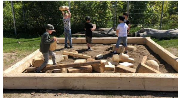
Den kreativa kvadraten som vi har valt att kalla den. Den kvadratiska ramen innehåller löst material som är spillmaterial från projektet. Här kan eleverna själva använda sin kreativitet till att bygga, ungefär som med klossar, i stort format som kräver fysisk aktivitet.