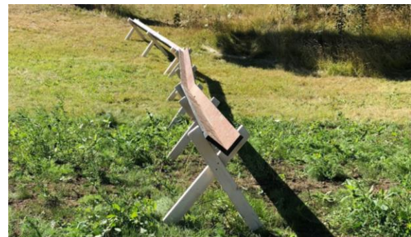
En vattenränna uppfördes på Sunnerby förskolas nya gård där modulerna står.