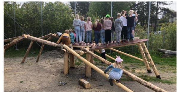
Korsspindeln på Svandammsskolan är mycket populär.