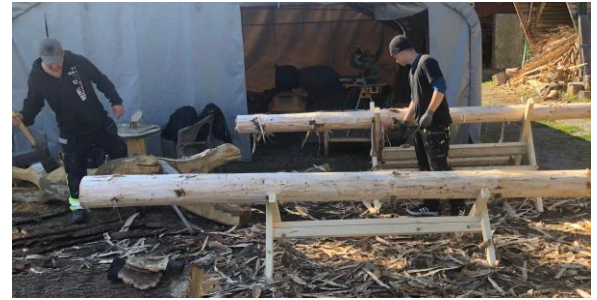
Mycket av arbetet i Lärmiljöprojektet sker innan installationerna på gårdarna. Här barkas stockar.

Ett mindre inramat område förses med löst material för att stimulera kreativ lek där eleverna själva bestämmer delarnas betydelse.