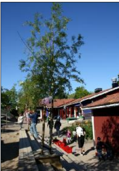
Vaktbergets förskola. En trappa för ökad rörelse och ett träd för ökad skugga prydligt integrerat på en trång och kraftigt solexponerad gård.

Vaktbergets förskola. En flicka tar sig genom snåret på den del av gården där staketet blivit utflyttat och ny mark införlivats. Det nya området stimulerar både till rörelse och upptäckter och det ger skugga när det behövs mest, under maj till augusti kl 11-15.