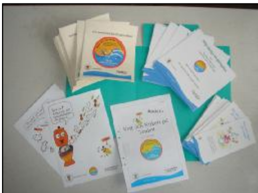
Innehållet i de mappar som packades och skickades ut till alla klasser på alla skolor och till alla förskolor i Nynäshamns kommun.