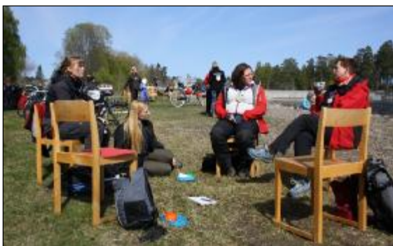
Open Space-diskussioner under det årliga mötet mellan Sveriges naturskolor under Naturskoleföreningens årsmötesdagar som detta år ägde rum i Älvkarleby.