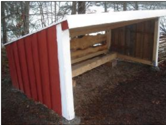
Vind- och regnskyddet ska skydda eleverna eller deras ryggsäckar under besöket på Naturskolan. Under försommaren förstördes hela vindskyddet av vandaler men byggdes upp under hösten igen.