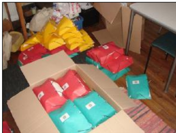
Mappar i olika färger för olika årskurser som skickades med internposten.