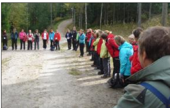
Avslutning under konferensen Mitt i naturen i Esbo i Finland där Nynäshamn Naturskola bidrog med workshop i utomhusmatematik.