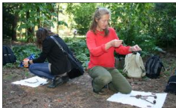
Nynäshamn Naturskola bidrog med workshop i utomhusmatematik under Nordens största konferens om utomhuspedagogik Ute är inne i Malmö.