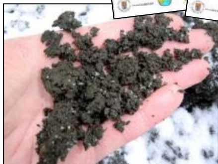
Så här ser slammet ut när det ligger på mellanlagring och väntar på att få läggas ut på åkern. I slammet finns den ändligen naturresursen och det livsnödvändiga näringsämnet fosfor.