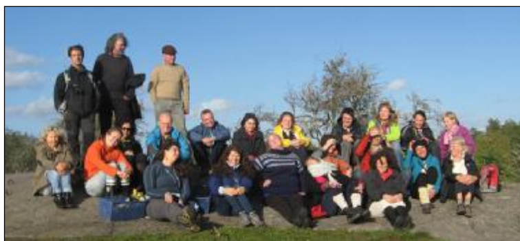
Nynäshamns Naturskola bidrog med workshop i matematik, svenska och engelska utomhus på Studieförbundets EU-dag Outdoor Learning i Kyrkhavn i Hässelby.