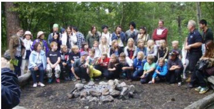
Peaceboat från Japan var på besök under en dag och fick träffa en klass från Svandammskolan som hade lägerskola på Naturskolan.