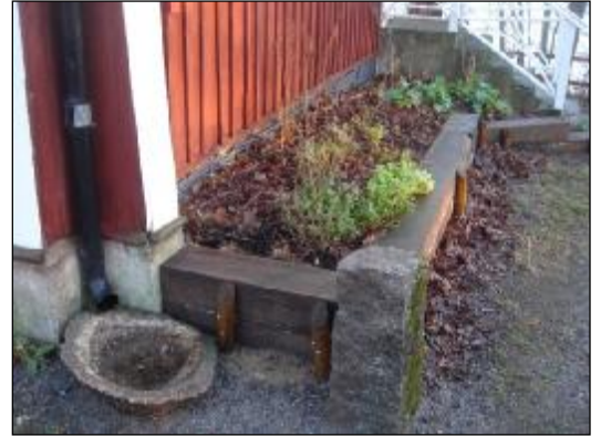
Fjärilslandet lockade fjärilar och andra insekter under sommaren. Bygget gjordes under biologiska mångfaldsåret 2010 som ett konkret exempel på hur mångfalden kan ökas i närmiljön. Nedan en karta över de olika växterna i rabatten.

Huset hyrs på vardagkvällar och ett stort antal helger av Ösmo Scoutkår som har omfattande verksamhet i huset och i omgivningarna.