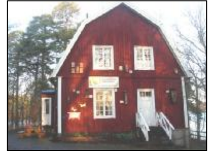
Nynäshamns Naturskolas hus på Sjöudden i Ösmo i Nynäshamns kommun.

Nynäshamns Naturskola startade 1988 och lokalerna ligger ute på Sjöudden vid sjön Muskan i Ösmo. Naturskolan tar emot barn/elever från 4 års ålder upp till 16 år från hela Nynäshamns kommun. Naturskola är inte en plats utan ett arbetssätt som bygger på utomhuspedagogik. Skolklasserna har en naturskoledag per läsår. Då bedrivs det ett undersökande arbetssätt kring ett tema. Inför varje Naturskoledag förbereds klassen av sin lärare, därpå sker efterarbete på hemskolan. Varje årskurs har sitt eget tema t.ex., småkryp i skogsbacken, sinnena, forntida tekniker, vinterekologi och inventering i Alhagens våtmark. Genom att på ett tidigt stadium vara ute mycket i naturen grundläggs en känsla för naturen. Det i sin tur ger en grund att vilja vårda vår natur och förstå våra miljöproblem.