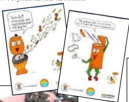
De två kampanj-affischerna.